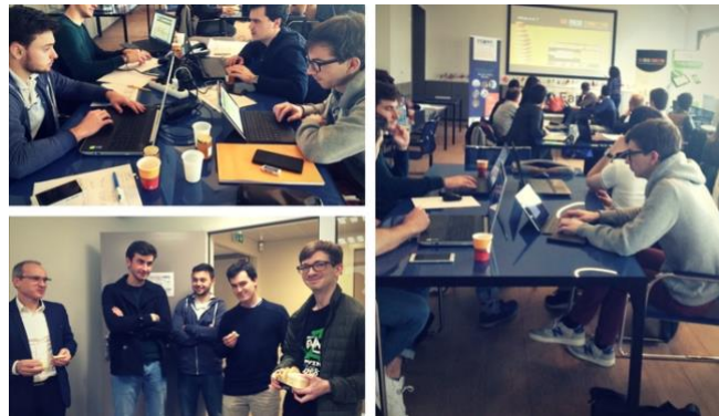
L'équipe d'étudiants de L'ECAM Lyon qui devançait même les industriel-les à la mi-journée !