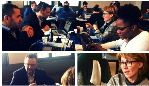
Une étudiante de l'ECAM Lyon parfaitement intégrée au sein d'une équipe composée d'industriel-le de Sanofi et de Clasquin, toutes deux entreprises adhérentes Fapics.