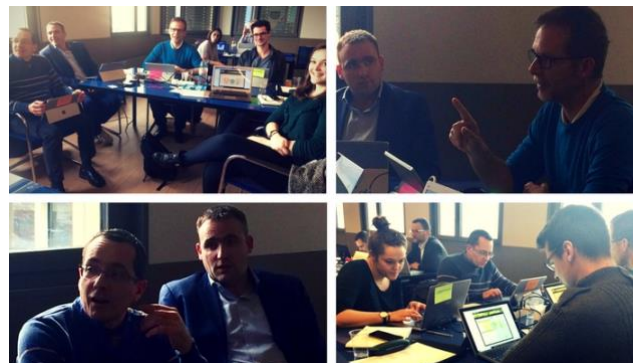
Le cabinet Advents consulting pour qui le serious game The Fresh Connection a été un formidable vecteur de team building.