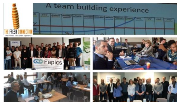
The Fresh Connection joué à Euralogistic, le Pôle d'Excellence Logistique et Supply Chain des Hauts de France et à l'ECAM Lyon avec le soutien du Pôle d'Intelligence Logistique Pil's d'Auvergne-Rhône-Alpes.