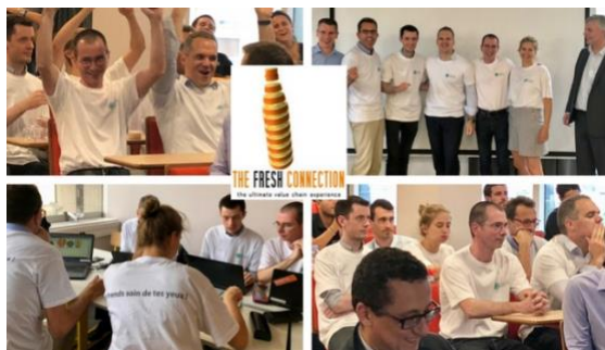
Finale Française du Challenge The Fresh Connection avec comme vainqueur ESSILOR le 07/07/2018

A l'issue d'une journée découverte serious games, les entreprises peuvent proposer à leurs salarié-es de s'impliquer dans le challenge national qui démarrera en avril 2019. Pour mémoire, cette année, en 2018, une dizaine d'entreprises françaises ont participé au challenge professionnel parmi lesquelles de grands leaders français comme ESSILOR, SANOFI, RENAULT, MICHELIN...C'est finalement ESSILOR qui a remporté en juin 2018 la finale nationale The Fresh Connection et qui a représenté la France à la finale mondiale qui s'est tenue à Milan le 28 septembre dernier. Au total plus de 300 équipes de plus de 60 pays jouent à ces Serious Games de Supply Chain Management, ce qui démontrent à fois un engouement pour ce type d'apprentissage et la volonté des entreprises de former et motiver leurs salariés autrement. Et ça marche. Preuve en est, la fidélité et le nombre croissant d'entreprises mais aussi d'universités-es qui chaque année, invitent leurs salarié-es et étudiant-es toujours plus nombreux à venir expérimenter ces serious games.