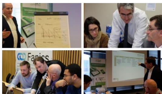
En présence des collaborateurs des Directes. Ci-dessus une équipe de la Directe Ile-de-France