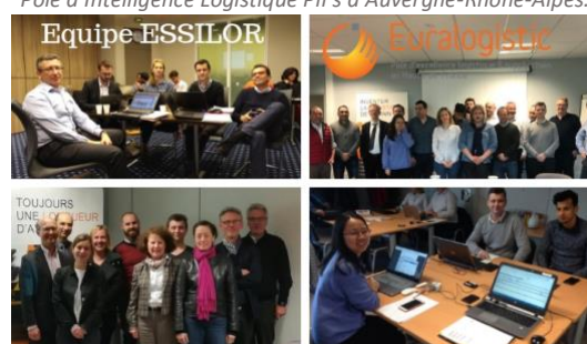
Avec la participation également des collaborateurs du pôle d'excellence régionale des Hauts de France Euralogistic.