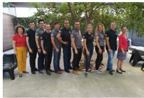
Global finale internationale à Milan avec deux équipes d'ESSILOR ESSILOR France et USA le 28/09/2018