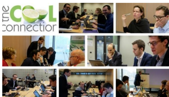
The Cool Connection le serious game Supply Chain et Finance Joué à la Direction générale des entreprises à Paris

Les précédentes journées découvertes qui se sont déjà tenues à Paris, Lyon, Lille et en région Bretagne ont déjà mobilisé plus qu'une centaine de salarié-es d'entreprises et d'institutions : MICHELIN, ESSILOR, AIR LIQUIDE, SANOFI, LEROY MERLIN, mais aussi des ETI comme CLASQUIN, TOURPAGEL, CHANTELE ou des écoles comme l'Université d'Artois, l'Ecole des Mines de Saint-Etienne, l'ECAM Lyon, l'Ecam Rennes, L'Université de Nantes ou des cabinets de conseil ainsi que des employés et fonctionnaires des DIRECTE Ile-de-France et Bretagne ou des CCI chargé-es de conseiller les entreprises sur leur développement. Grâce à l'expérience des précédentes étapes et au soutien institutionnel des pouvoirs publics et des partenaires de Fapics, présents à Toulouse la mobilisation en région Occitanie s'amplifie.